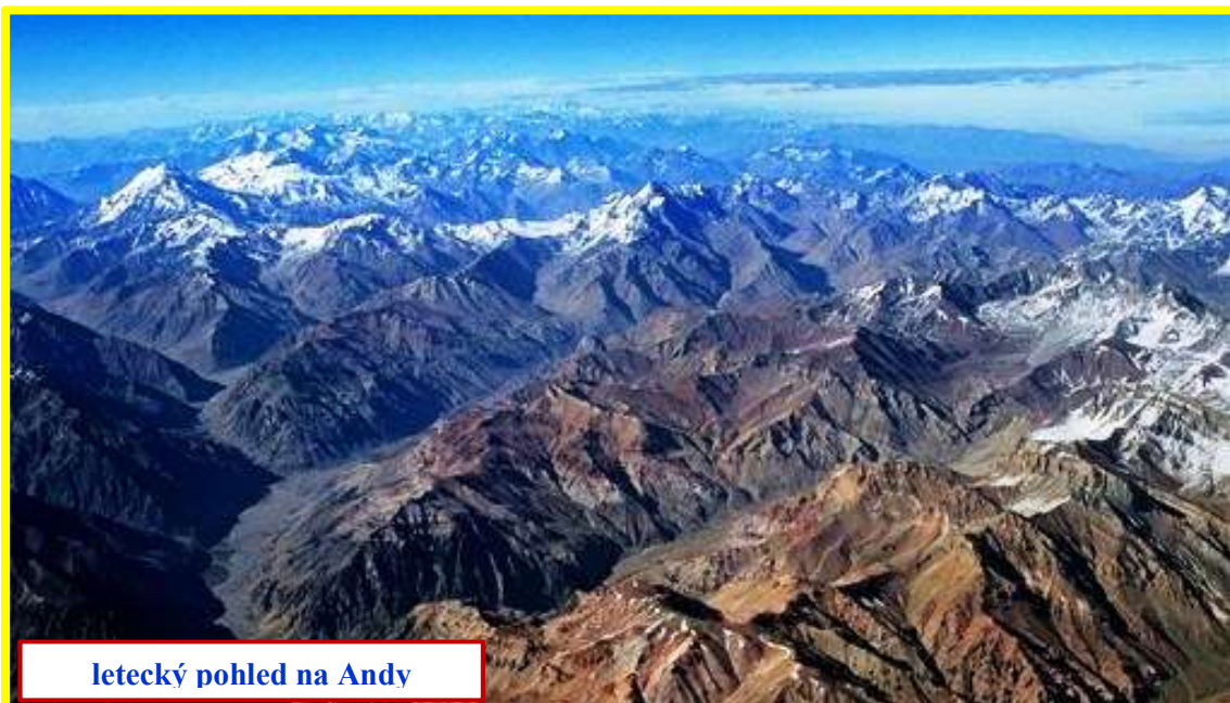
letecký pohled na Andy