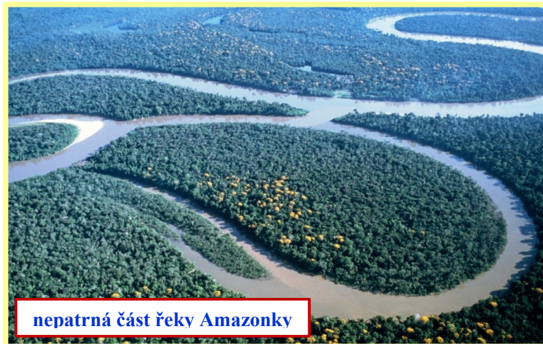
nepatrná část řeky Amazonky