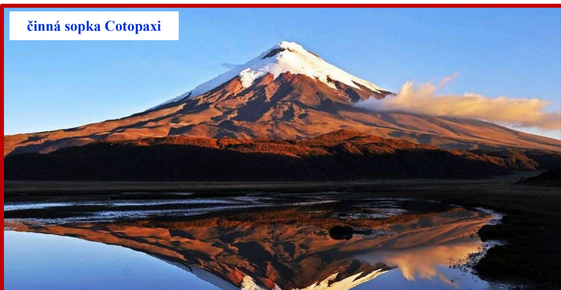
činná sopka Cotopaxi