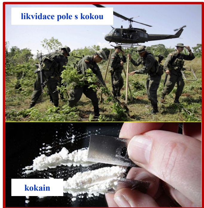
likvidace pole s kokou