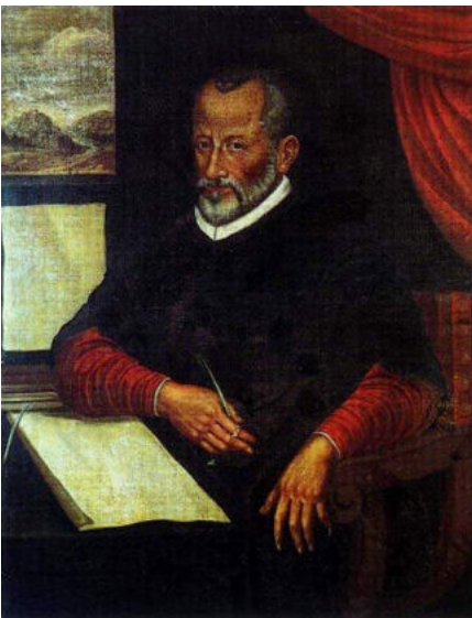
Giovanni Pierluigi da Palestrina

Vrcholu vokální polyfonie dosáhli v 16. století renezanční mistři: